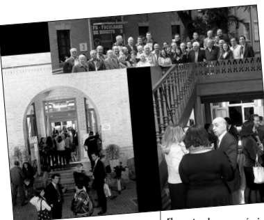
Flagrantes dos memoráveis corredores universitários

Contato com a Abamack: Avenida da Liberdade, 65 - cj.108 - SP e-mail: contato@abamack.com.br Site: www.abamack.com.br (telefone (11) 3105-7073)