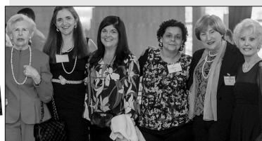
A presença feminina da Abamack deu brilho à festa